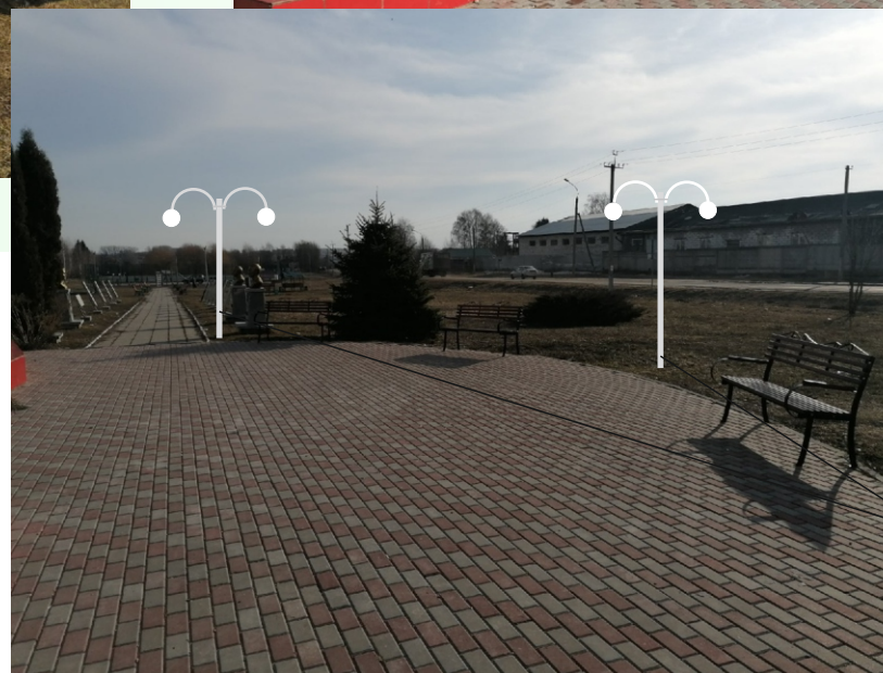
Проектное решение № 3. Устройство декоративного освещения